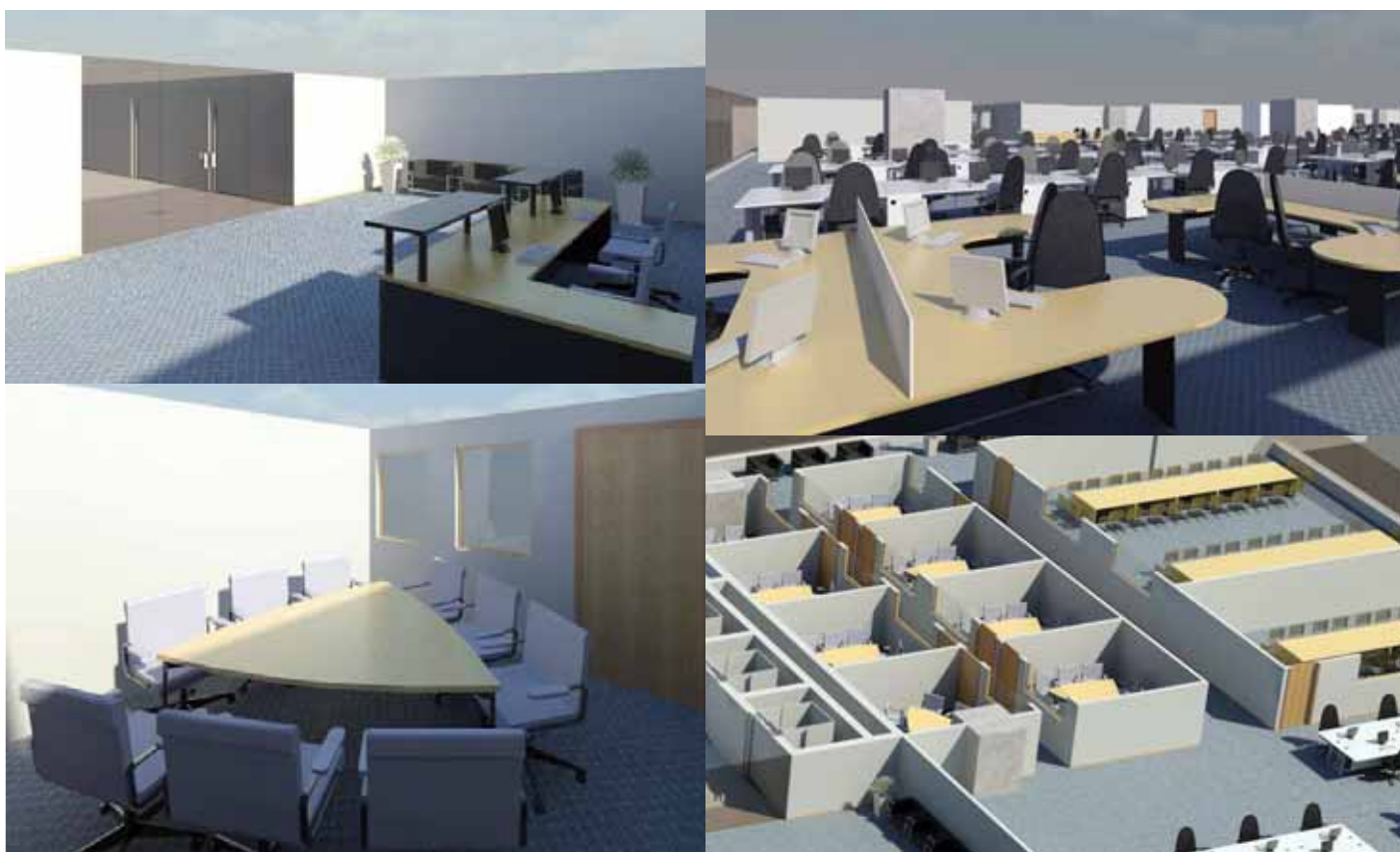
Da esquerda para direita no sentido horário: maquetes eletrônicas das áreas de recepção, gestão e produção, vista das salas de reunião, sala de reunião tipo